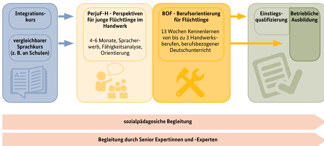
Abbildung 2: Initiative ‚Wege in Ausbildung für Flüchtlinge‘